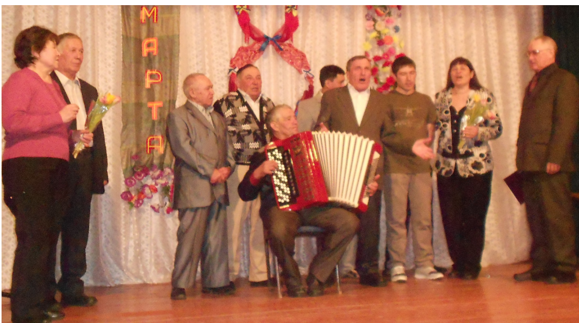
Ир-егеттәр байрам алдынан күзәл заттарзы ысын күңелдән тәбрикләһе.