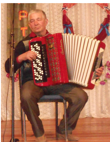
Баянсы Кәһәфи Кзрасов.

Тамашасылар артистарыбыздың һәр сығышың көтөп алды, көслә алкыштарға күмдә