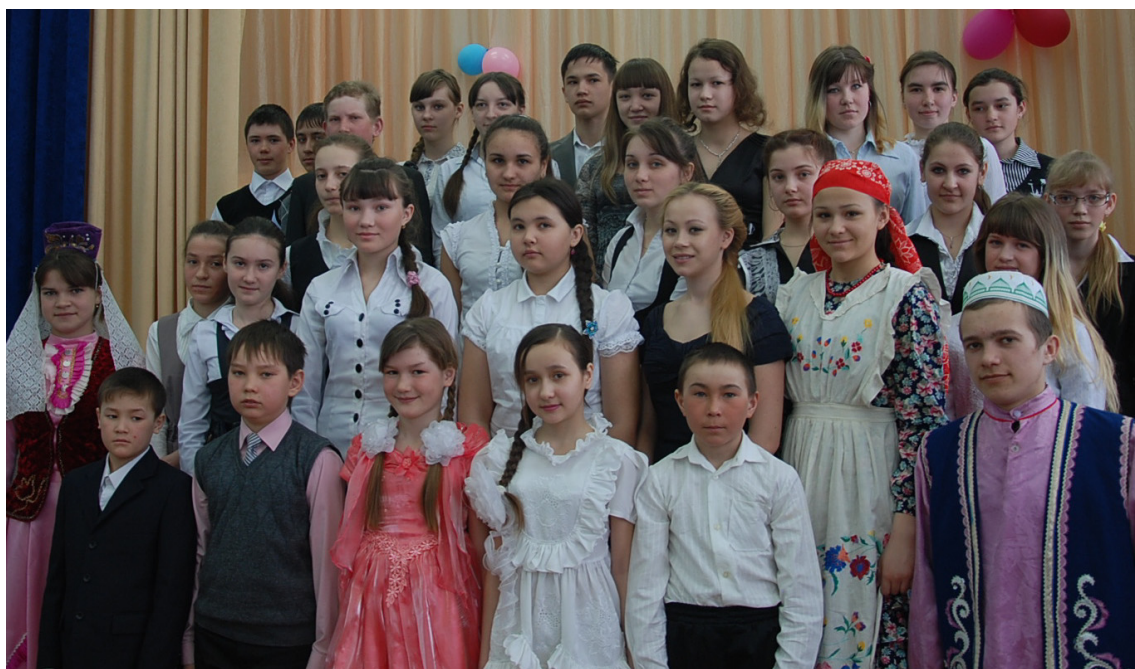
Сарала өзәм катнашқан малайзар һәм кыззар.